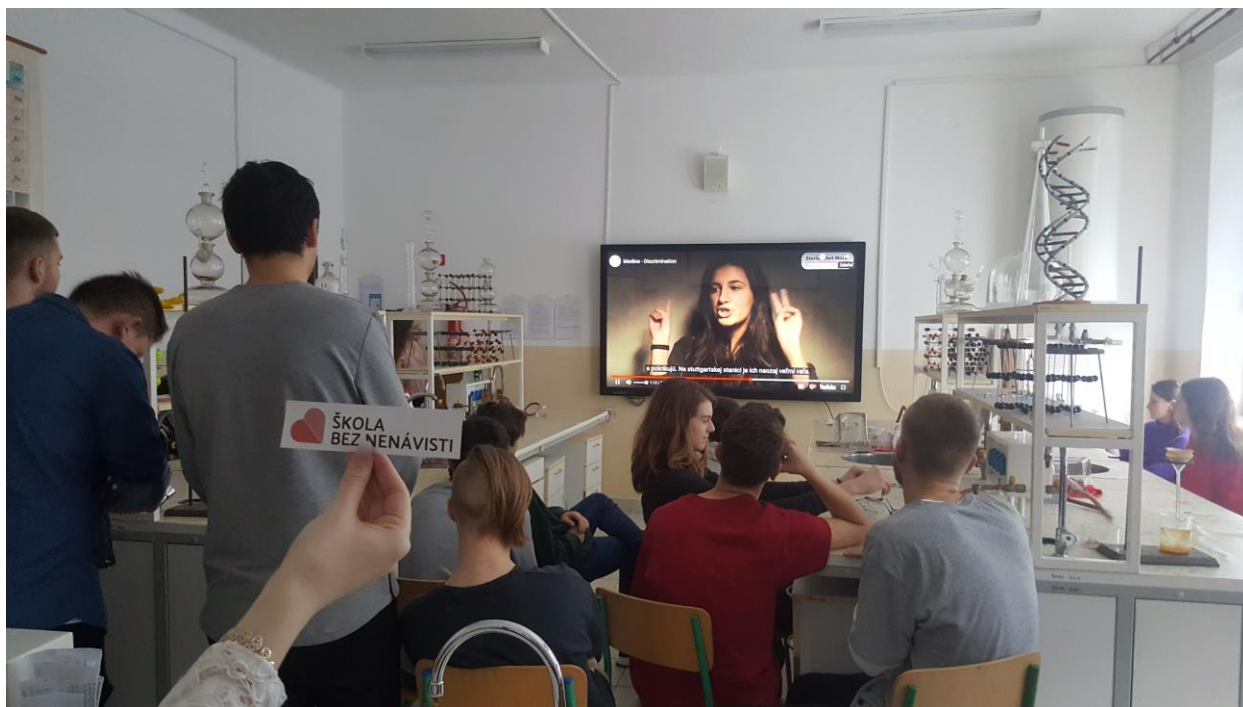
Obr. 2: Fotodokumentácia aktivity školy GYMBN1803

SPŠ dopravná vo Zvolene pripravila pre žiakov 9. ročníka základných škôl autorskú výstavu s názvom Osudy spútané ostnatým drôtom . Súčasťou výstavy boli obrázky s témou holokaustu a lektorský výklad našich študentov, ktorý je zameraný na osudy slovenských židov počas 2. svetovej vojny. Dĺžka trvania výstavy bola jedna vyučovacia hodina a určená pre jednu triedu. K vystaveným fotografiám žiaci pod vedením pedagóga pripravili komentovaný sprievod.