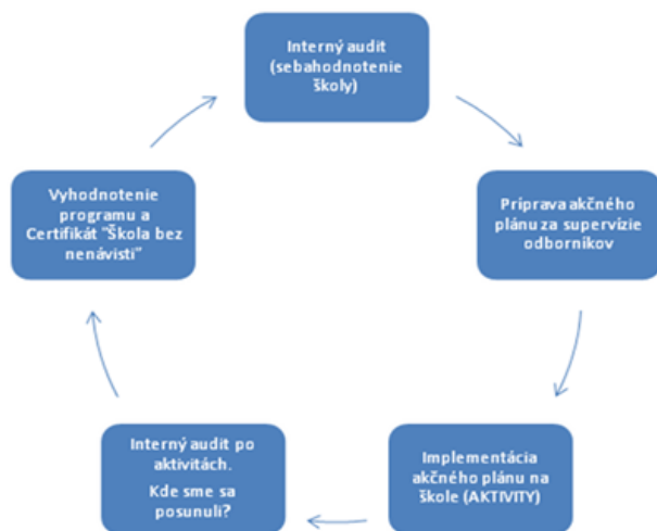
Obr. 1: Hlavné fázy cyklu programu Škola bez nenávisti z pozície školy