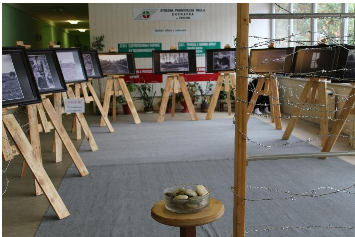
Obr. 3: Fotodokumentácia aktivity školy SŠZV1801